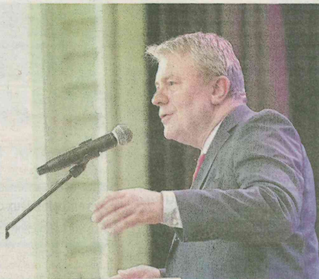
Jean-Paul Lecoq n'a pas manqué de parler du contexte social.

Autre thème largement abordé lundi soir, celui de l'urgence environnementale, citant ce qui s'est passé encore récemment en Australie. Il évoque ainsi un défi à relever. « Cette urgence écologique est contradictoire et même rédhitoire avec la logique économique, cette logique de compétition permanente qui est en vigueur (...) Ayons confiance en l'homme, en la jeunesse (...) » Pour le député, la transition écologique doit se faire graduellement, sans rupture, tout en associant tous les acteurs du territoire. Sur ce sujet et pour y contribuer, Jean-Paul Lecoq propose la tenue d'états généraux locaux associant État, collectivités, entreprises, chercheurs, associations et habitants. Il parle aussi d'une urgence éducative et des moyens à déployer pour y parvenir.